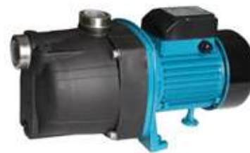
JSW 150 GARDEN

Jednostopniowa, samossąca, odśrodkowa pompa powierzchniowa, wyposażona w układ podnoszący zdolność zasysania, dzięki zastosowaniu tuby Venturiego. Przeznaczona do pompowania czystej, zimnej wody z własnych ujęć oraz podnoszenia ciśnienia. Pompy znajdują zastosowanie przy zaopatrywaniu w wodę domów, działek rekreacyjnych oraz przy nawodnieniach.